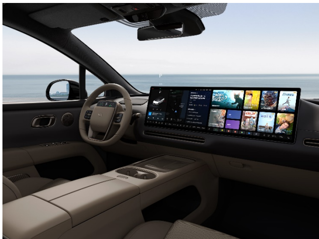
Коричневый / тёмный потолок