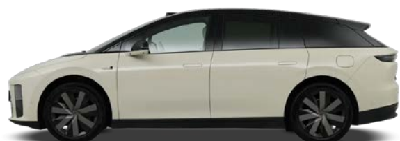
Светло-бежевый / чёрная крыша (+ 3 000 BYN)