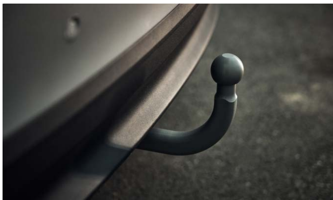
Фаркоп (+1 750 BYN)