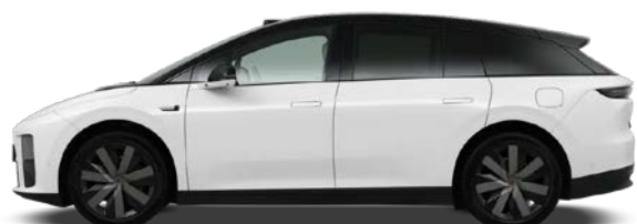
Белый / чёрная крыша