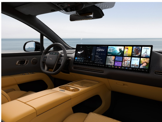
Оранжевый / тёмный потолок