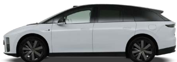
Серебристый / чёрная крыша