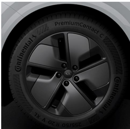
Black Ideal 255/50 R20 (в базе для Max)