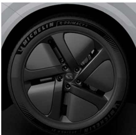
SG Eagle 265/45 R21 (в базе для Ultra / +6 450 BYN для Max)