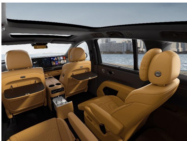
Оранжевый / тёмный потолок