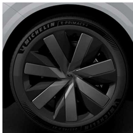
Black Cat 265/45 R21 (в базе для Ultra / +6 450 BYN для Max)