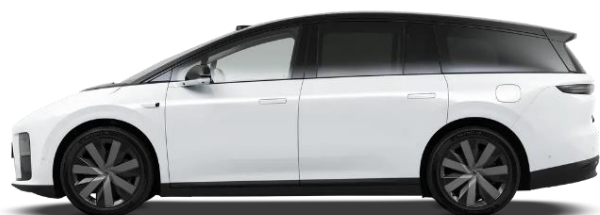
Белый / чёрная крыша