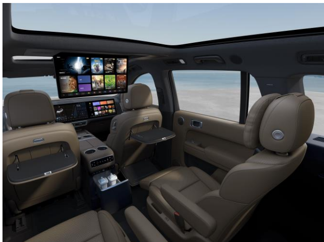
Коричневый / тёмный потолок