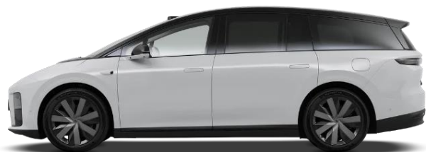
Серебристый / чёрная крыша