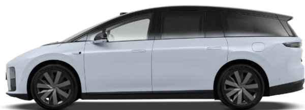
Светло-голубой / чёрная крыша (+ 3 500 BYN)