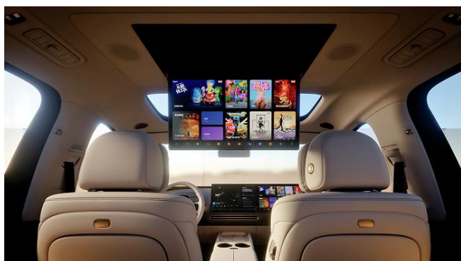
21,4" дисплей для задних пассажиров (в базе для Ultra / +7 200 BYN для Max)