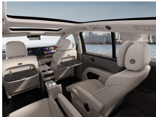
Бежевый / коричневые элементы